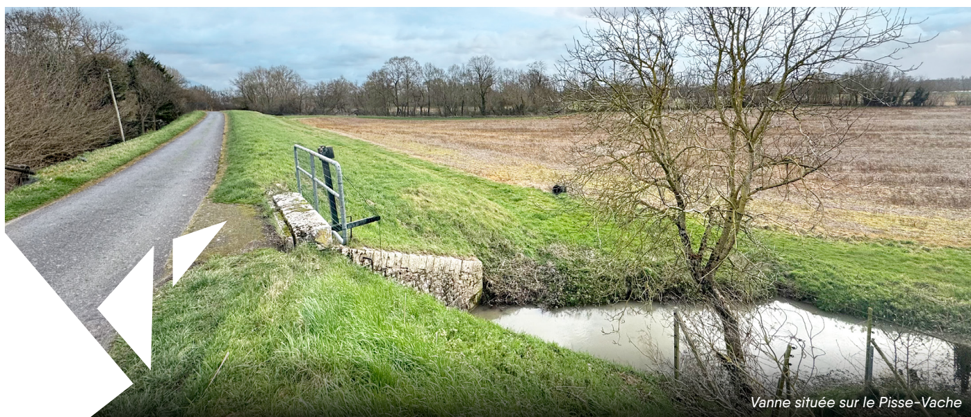
Vanne située sur le Pisse-Vache

cas de crues. Lors de cet épisode, les équipes ont fait preuve d'une efficacité exemplaire, démontrant la valeur des formations suivies et la solidarité entre les communes et la CCBVL. Cet événement prouve que notre territoire est désormais prêt à faire face aux défis environnementaux de demain.