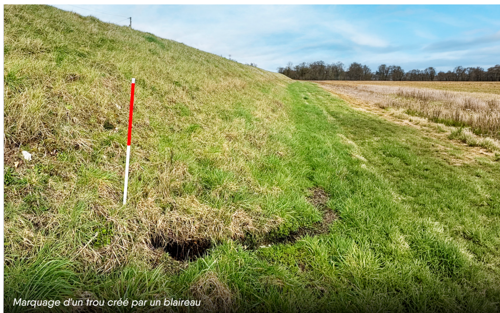
Marquage d'un trou créé par un blaireau

Ce dernier, avec la CCBVL, assure le suivi technique et la coordination en cas de crise, tandis que les communes